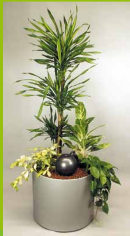
Bsp. 6 Dracaena Rikii Aglaonema 'Green Sun' Dracaena godseffiana Philodendron scandens Lichtanspruch schattig-halbschattig Gefäß Expert RU60 H52 mit Rollen Wasservorrat ca. 50 Liter