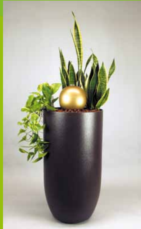
Bsp. 8 Sansevieria trifasciata Epipremnum aureum Lichtanspruch schattig-halbschattig Gefäß Chamaeleon D42 H75 mit Rollen Wasservorrat ca. 45 Liter