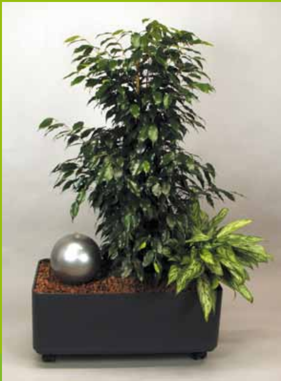
Bsp. 5 Ficus 'Danielle' Aglaonema 'Silver King' Lichtanspruch halbschattig Gefäß G 35 x 70 mit Rollen Wasservorrat 12 Liter