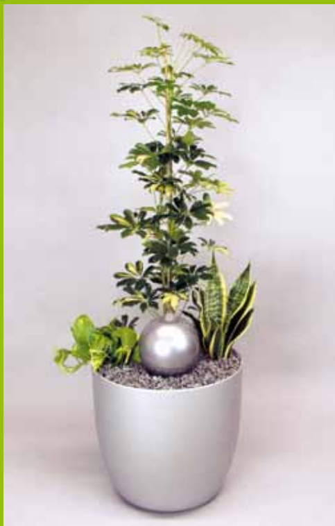
Bsp. 7 Schefflera 'Gold Capella' Sansevieria trifasciata Lichtanspruch schattig-halbschattig Gefäß Chamaeleon D51 H47 mit Rollen Wasservorrat ca. 35 Liter